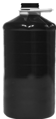
Dóza 3,5 l

Jednoduchá konstrukce držáku spolehlivě drží a umožňuje dávkování mycího prostředku. Balení mycích suspenzí obsahuje sadu, pomocí které snadno namontujete dávkovací pumpu na dózu. Slouží k tomu plastová matice, která fixuje dávkovací pumpu ve středu dózy.